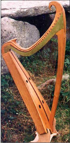
Harpe Sarr ... 37 Cordes, F-g '''

Low-Headed Clairséach, Dublin/Trinity College, 15. siècle, 30 cordes, a-b ''' , en bronze phosphore.