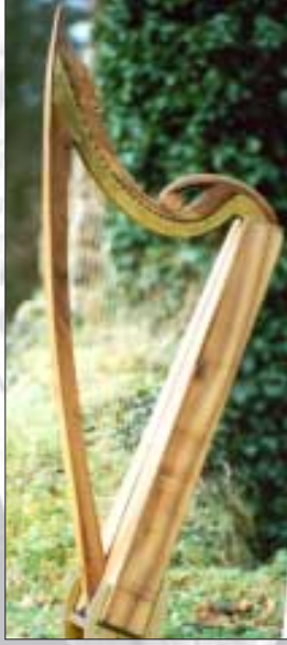
...et Mullagh-Mast 35 Cordes, G-f '''

High-Headed Clairséach, 17. siècle, musée national Dublin, cordes en bronze phosphore, demi-tons excellentes (Bronze, P. Brough)