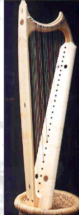
Modèle Wartburg, 27 cordes, F-d '''

Cettes instrumentes sont aussi en vente avec incrustations et ornementation originell.