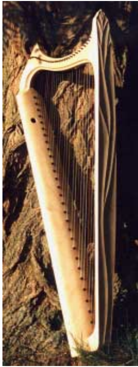
Modèle Wartburg (agrandit) 30 cordes, C-d '''

High-Headed Clairséach, 17. siècle, musée national Dublin, cordes en bronze phosphore, demi-tons excellentes (Bronze, P. Brough)