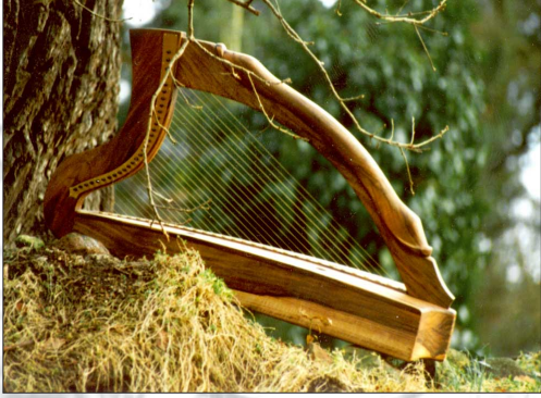
Harpe de Brian Boru

Low-Headed Clairséach, Dublin/Trinity College, 15. siècle, 30 cordes, a-b ''' , en bronze phosphore.