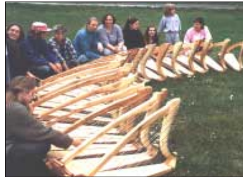
Baukurs Mosenberg 1996