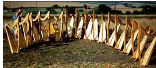
Mosenberg Baukurs 1993