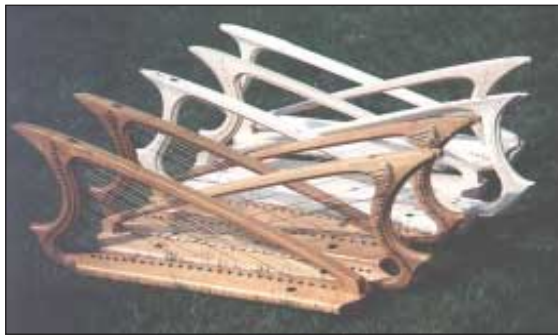
Baukurs Michaelstein 1994